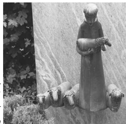
Jesus aber nennt sich darum den guten Hirten, weil er für seine Schafe stirbt. (Dietrich Bonhoeffer)